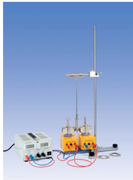
Fig. 2 Montaje péndulo de Waltenhofen