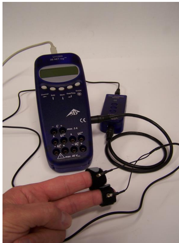
Fig. 1 Misurazione della resistenza cutanea di una persona