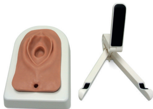
Fig. 3: simulatore nel basamento con supporto