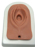
Fig. 2: simulatore nel basamento