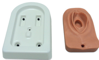
Fig. 1: simulatore e basamento