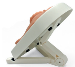
Fig. 4: simulatore nel basamento posizionato nel supporto inclinato