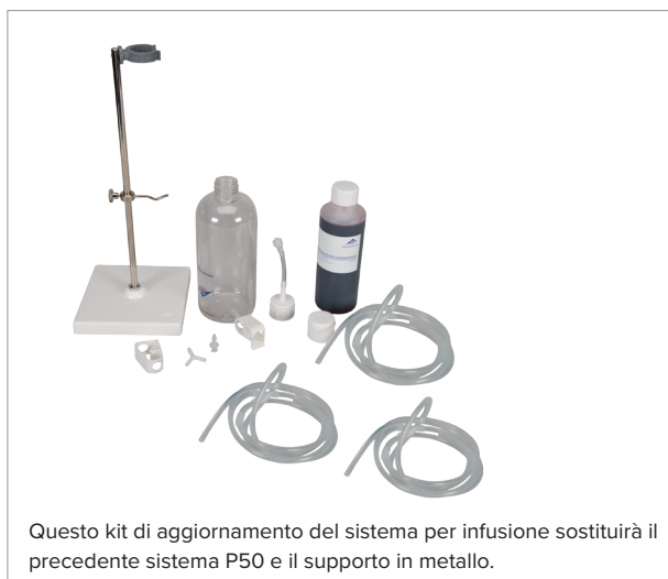
Sistema per infusione precedente